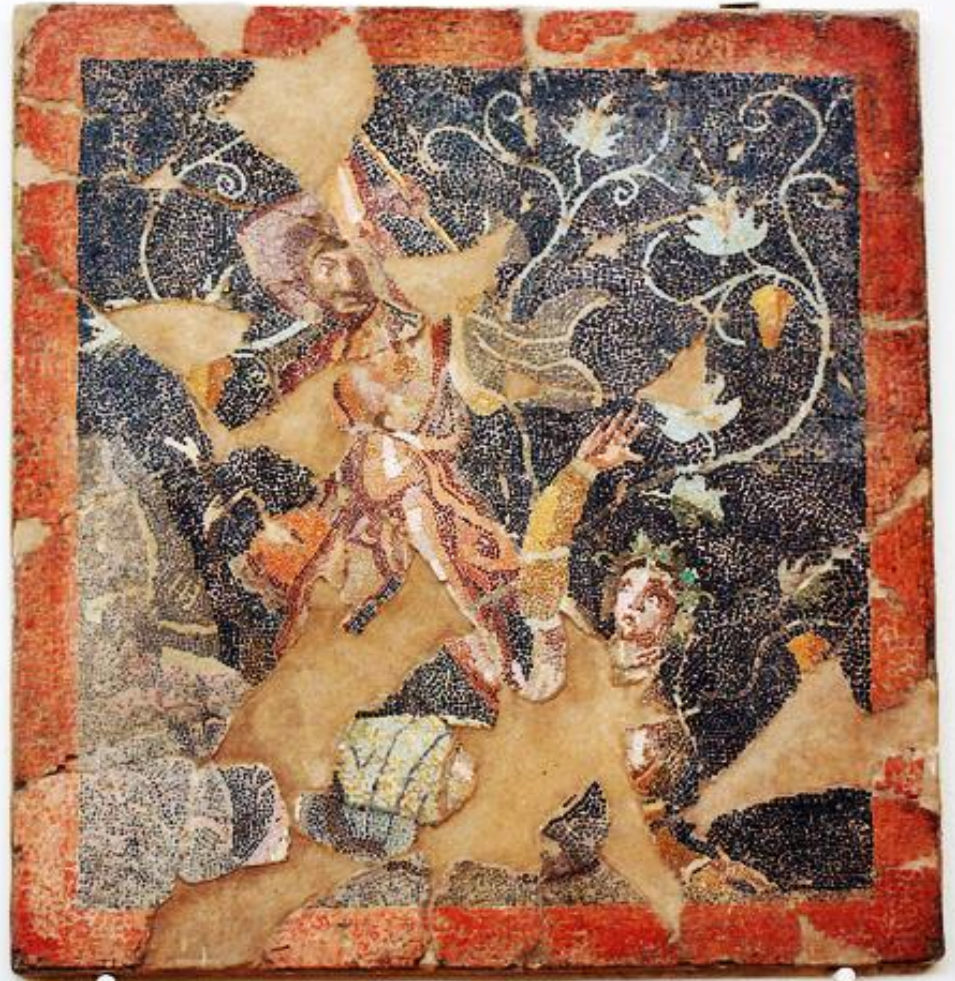
Ο Λυκούργος επιτίθεται στην Αμβροσία. Ψηφιδωτό από τη Δήλο

Όπως η νύμφη Αμβροσία που της επιτέθηκε ο Λυκούργος με πέλεκυ. Η Γη μεταμόρφωσε τη νύμφη σε κλήμα που τον στραγγάλισε.